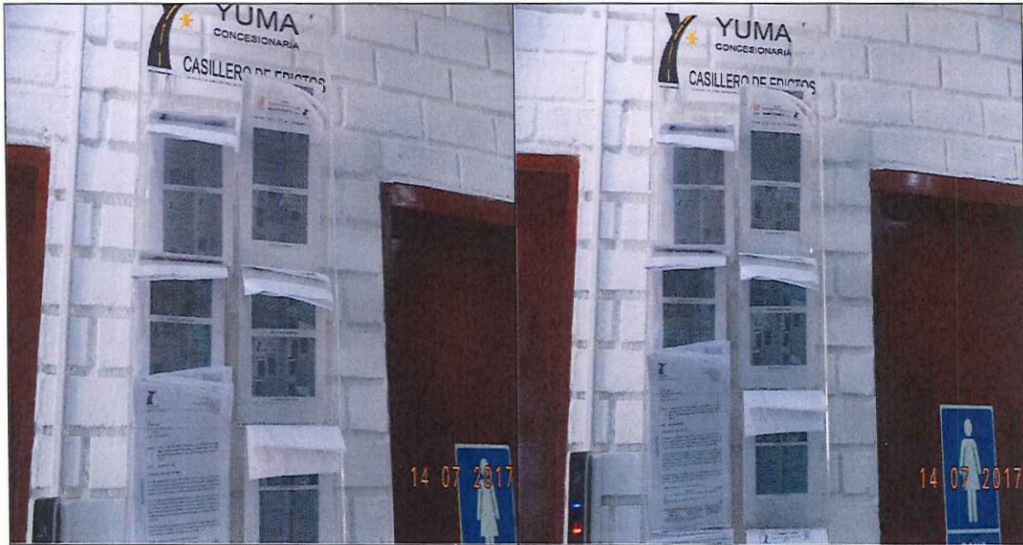
PUBLICACIÓN POR EDICTO P_03166

Fecha: (d-m-a) 14 07 2017 Lugar: OFICINA ATENCIÓN AL USUARIO